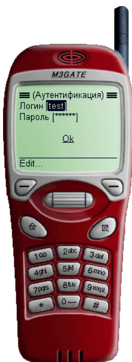
Рис. 2.2. Ввод логина и пароля клиента

списка. На экране отобразится окно (см. рис. 2.3 ) с наименованием банка и следующими разделами информации о банке, которые может просмотреть клиент: