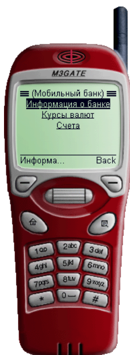
Рис. 2.1. Стартовое меню WAP-Банкинга