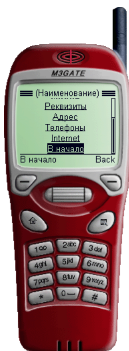
Рис. 2.3. Просмотр информации о банке