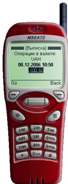
Рис. 2.5. Просмотр выписки по счету

Для просмотра информации об операциях воспользуйтесь ссылкой Далее . На экране отобразится страница (см. рис. 2.5 ) с информацией об операциях над счетом: валюта операции, дата и время совершения операции, сумма операции и тип операции (дебет – "-", кредит – "+").