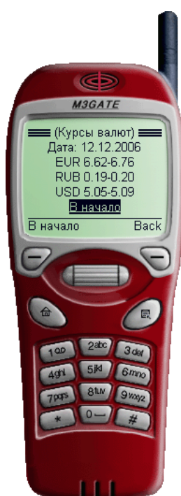
Рис. 2.4. Просмотр курсов валют

выписку (максимальная глубина выписки – 99 дней). Для получения выписки выберите ссылку Далее .